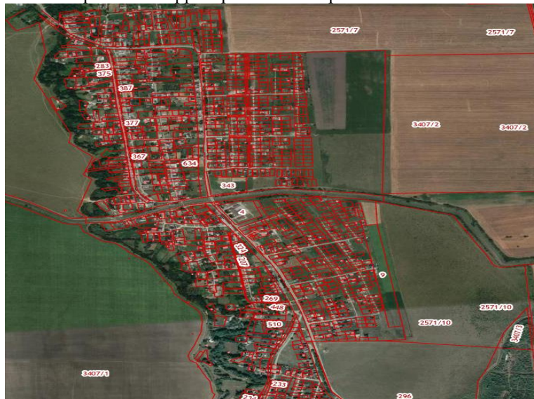
Рисунок 2 - Расположение застройки на территории МО «Старо-Атагинское сельское поселение»

Расширение населенного пункта (село Старые Атаги) предусмотрено в северно-западном и юго-западном направлении индивидуальной жилой застройкой. Административный центр будет сохранен.